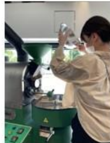
焙煎機に生豆投入